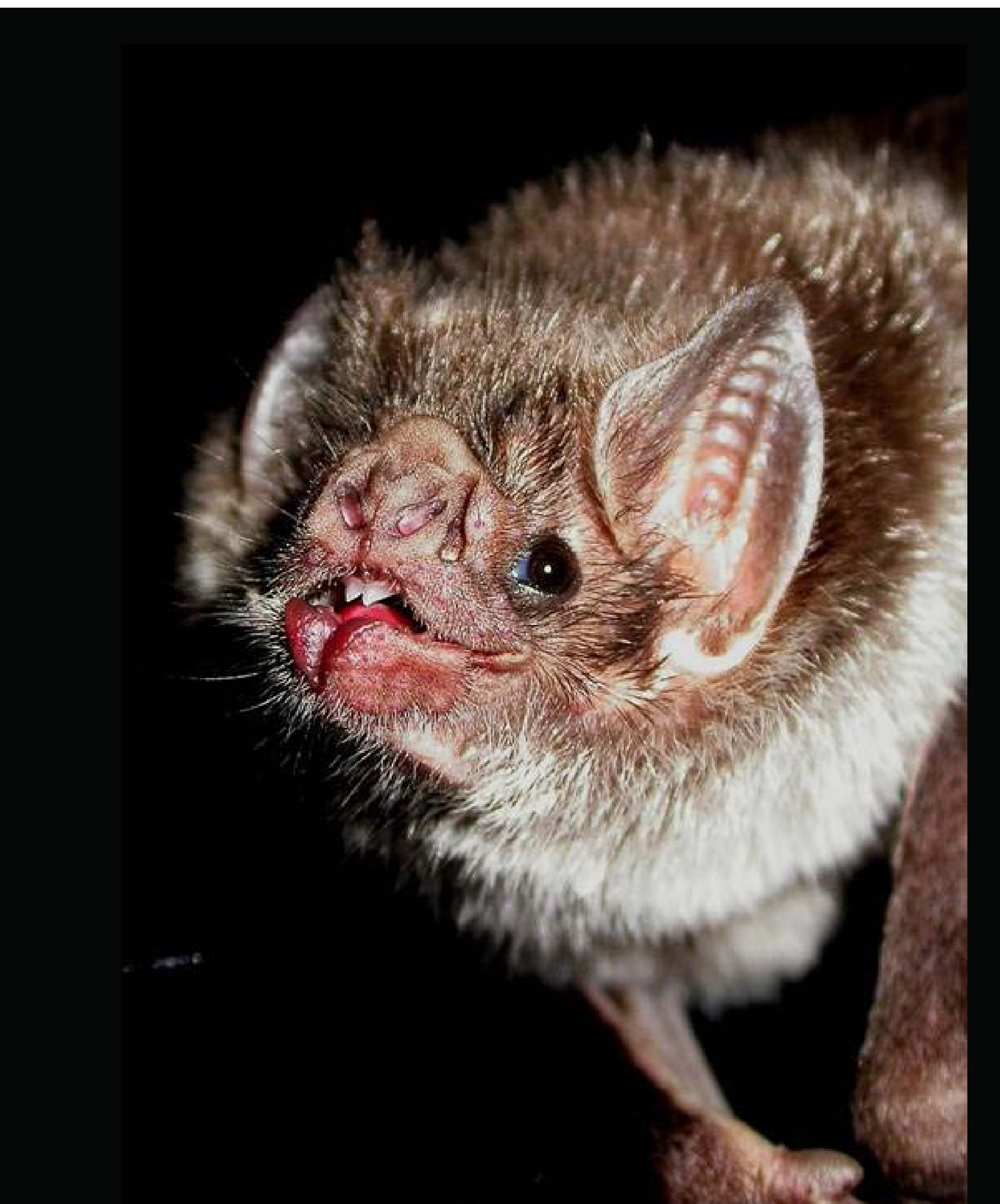
Desmodus rotundus ist eine von drei echten Vampirfledermausarten in Panguana